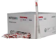
Einzeln verpackte Pipetten