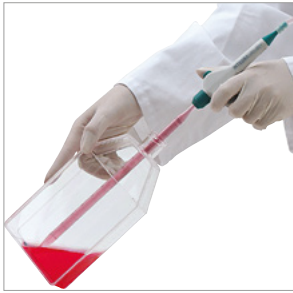
适用于T型烧瓶的VACUBOY适配器和吸液管