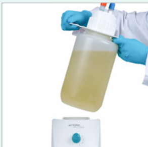
收集瓶提手可安全转运