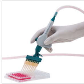
适用于孔板中液体吸取的多通道VACUBOY适配器