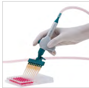
プレートから液体を吸引するための マルチチャンネルVACUBOYア ダプター