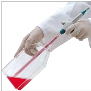
Tフラスコと吸引ピペット用 VACUBOYアダプター