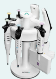
Support rotatif (#3213)