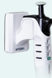
Support mural (#3205)