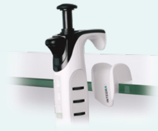
Support d'étagère (#3210 et #3211)