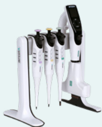
Support linéaire court (#3214)