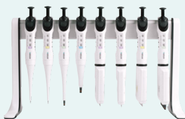
Support linéaire (#3215)