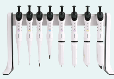
Linearer Pipettenständer (3215)