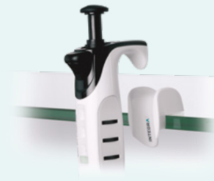
Regalpipettenhalter (3210 et 3211)