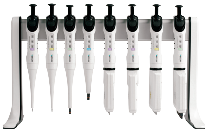
Linearer Pipettenständer (3215)

Pipetten sollten aufrecht gelagert werden, damit keine Flüssigkeit oder Rückstände in den Spitzenhalter gelangen kann. Die sachgerechte Aufbewahrung verlängert die Lebensdauer einer Pipette. Der lineare Pipettenständer von INTEGRA ist das ideale Zubehör, um EVOLVE-Pipetten über dem Labortisch hängend aufzubewahren. Ein linearer Ständer fasst bis zu zwölf manuelle Pipetten. Die EVOLVE-Regalpipettenhalter sind ein weiteres praktisches Zubehör für die sachgerechte Aufbewahrung.