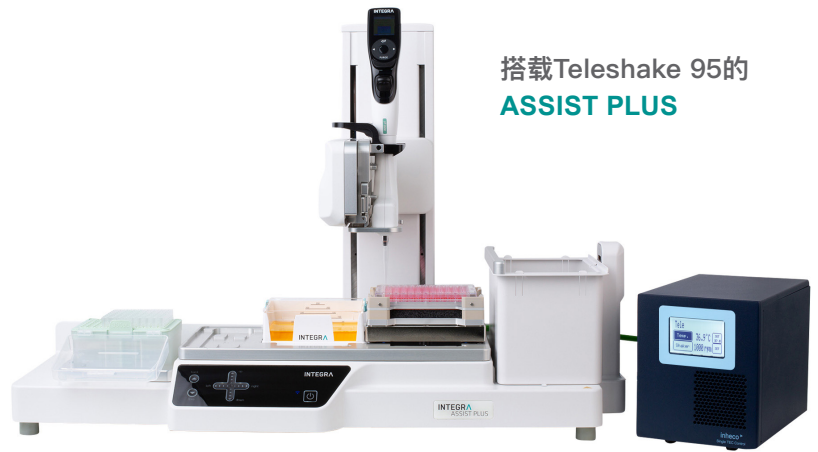
搭载Teleshake 95的 ASSIST PLUS

ASSIST PLUS 和VIAFLO 96/384可提供便捷、高性价比的多通道移液功能, 加速并简化了日常工作, 同时减少手动操作、人为错误和疲劳。INTEGRA为这些移液系统提供了可选的加热、冷却和振荡装置以确保其适用于更多应用。