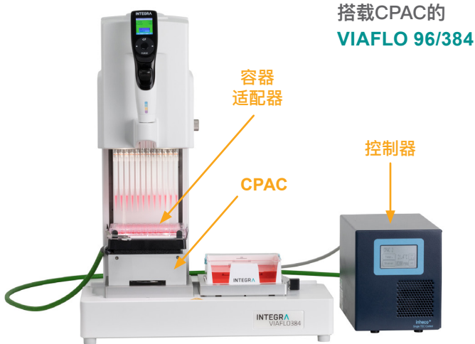
搭载CPAC的 VIAFLO 96/384