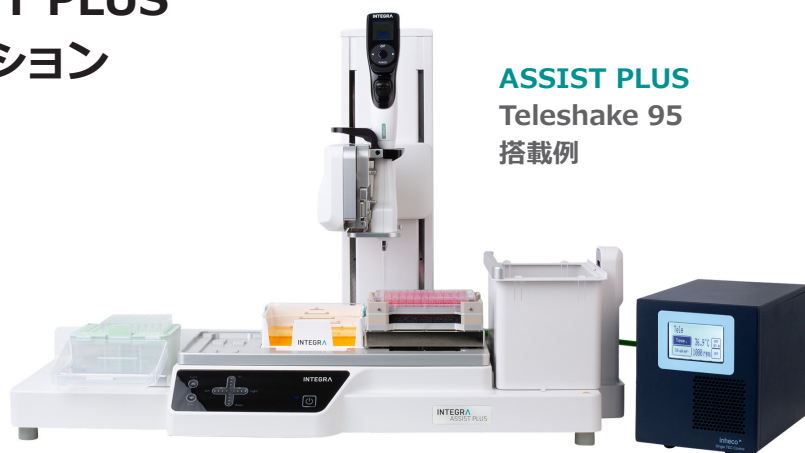
ASSIST PLUS Teleshake 95 搭載例

ASSIST PLUSやVIAFLO 96/384は、簡便かつ費用対効果の高いマルチチャンネルピペッティング能力を提供し、日々の業務の時間短縮と簡易化を実現すると同時に、煩雑な手作業、人的エラーおよび疲労を軽減します。INTEGRAは、さらに、できるだけ幅広いアプリケーションに適用できるように、これらのピペッティングシステムとともに使用可能な、加熱、冷却およびシェーカー装置をオプションとして提供します。