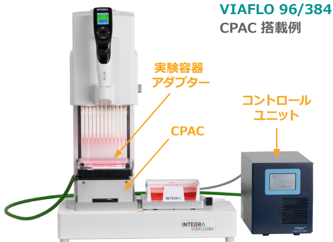
VIAFLO 96/384 CPAC 搭載例